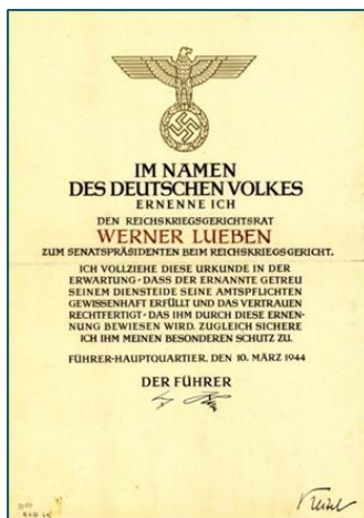
Bild: Ernennungsurkunde zum Senatspräsidenten beim Reichskriegsgericht, unterzeichnet von Adolf Hitler, 10. März 1944.